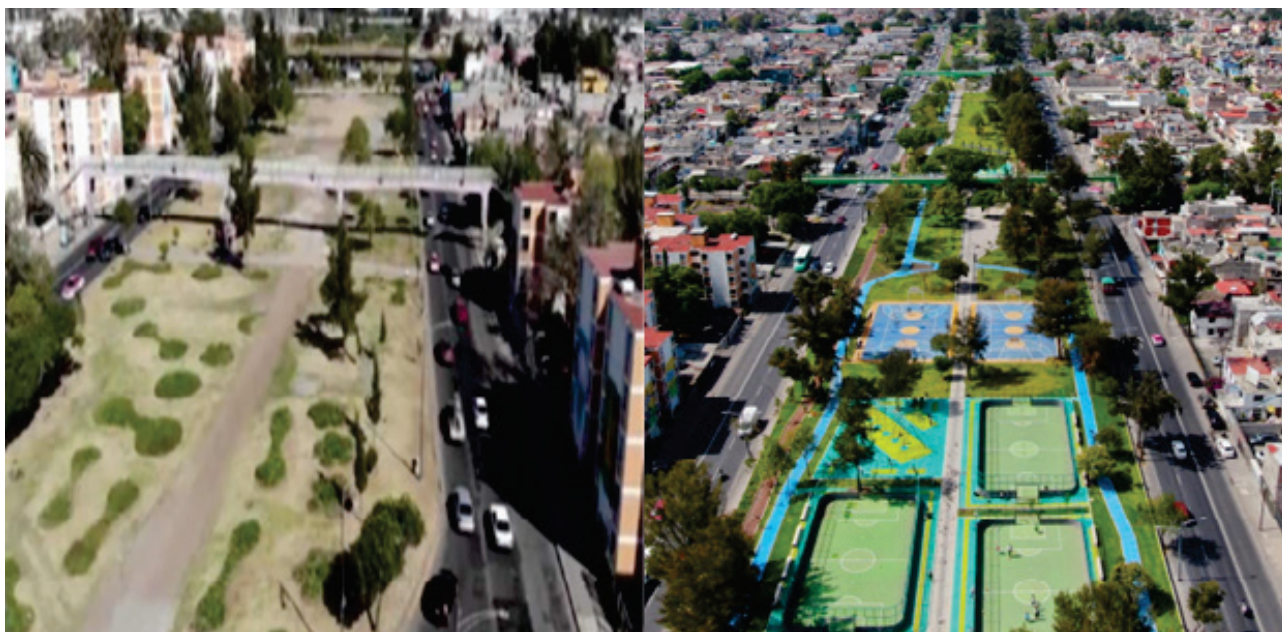
FIGURA 2. Parque Periférico Oriente antes y después de su remodelación

El parque lineal Periférico Oriente juega un papel importante como lugar de ocio, recreación y encuentro entre los distintos grupos sociales, donde se desarrollan prácticas deportivas y sociales, pero también culturales y educativas, y todo en conjunto forma un espacio más integral que beneficia a los usuarios y vecinos.