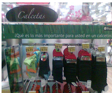
Imagen 03. Estand publicitario de punto de venta en un supermercado de Bogotá, 2009.

Puede pasar que los útiles pierdan su insignificancia, que pensemos y preguntemos sobre ellos: ¿quién cerró la puerta?, ¿por qué se regó el agua?, ¿dónde está el martillo?, ¿por qué no funciona el teléfono?, ¿por qué la silla es tan incómoda? Y entonces ya no son confiables. Cuando los útiles no están averiados, están bien fabricados y se encuentran en su sitio y a la mano (en su zona), nos ocupamos sin preguntar.