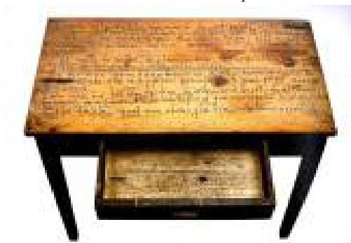
Imagen 05. Víctor Grippo (1936-2002), Tabla , 1978.

La condición estable del mundo, más estable en sus producciones que en sus actividades, y más permanente que la vida de un ser humano, y sin embargo cambiante por la obra conjunta de la vida humana, abre la pregunta ¿Cuál es entonces el ámbito espacial de una obra de arte? Lo que sugiere el concepto de mundo, tal como lo presenta Heidegger y lo mantiene Hannah Arendt, es que si bien hay ciertos ámbitos de la vida de los que no se pueden desprender el filósofo, el artista y el existente común, desde los cuales ejercen su actividad, y no son exclusivos del artista, hay ámbitos especialmente propicios para mostrar en la obra de arte lo que sucede en la experiencia existencial.