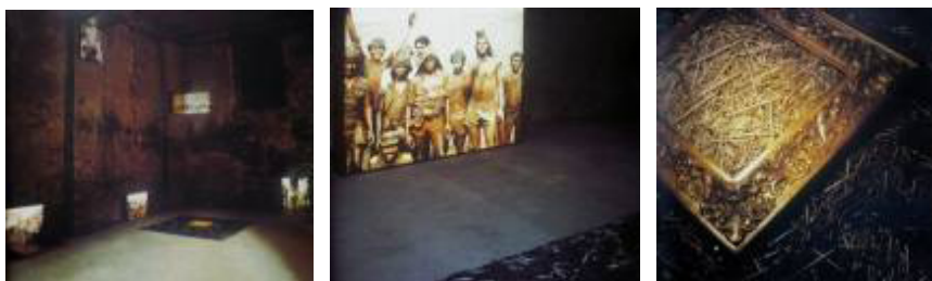
Imágenes 26, 27 y 28. Alfredo Jaar. Gold in the morning , 1986.

En el mismo año Jaar presentó para la Bienal de Arte número 42 de Venecia 'Gold in the morning', una instalación de cajas de luz con fotografías en transparencias de los mineros, junto a marcos y clavos dorados que aluden al oro. En ambas obras el contexto internacional de su presentación insertaba su sentido en los flujos del arte y la economía mundial.