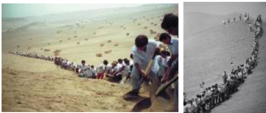
Imágenes 15 y 16. Francis Allÿs. Cuando la fe mueve montañas . Lima, octubre 2000- 11 abril 2002. Registro fotográfico y en video de la acción artística.

El 11 de abril de 2002, cerca de Lima (Perú), más de quinientas personas se reunieron, convocadas por el artista belga-mexicano Francis Allÿs (con la colaboración de Rafael Ortega y Cuahuctemoc Medina), para correr una montaña usando palas. Al cabo de tres horas la montaña (una duna), había sido corrida en una distancia de dos milímetros, resultado imperceptible pero que por medio de un proceso natural hubiera tardado posiblemente cientos de años y, lo más importante, no tuvo otra utilidad práctica que el hecho de lograr la reunión y la colaboración de tal cantidad de gente. Se trató de una acción artística llamada ‘Cuando la fe mueve montañas’, planteada dentro del marco de la Bienal de Arte de Lima.