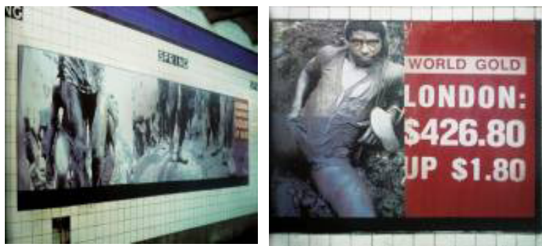
Imágenes 24 y 25. Alfredo Jaar. Rushes , 1986.

del oro en la bolsa, todo esto instalado en las paredes de la estación Spring Street del metro de Nueva York. Los transeúntes y pasajeros del metro se encontraban así con los dos extremos del proceso del oro, su producción y su valoración. Estos extremos ponen en percepción la escasez evidente de bienes de uso en la vida de los trabajadores en contraste con la exposición de una cifra que representa la riqueza representativa derivada del producto de ese trabajo.