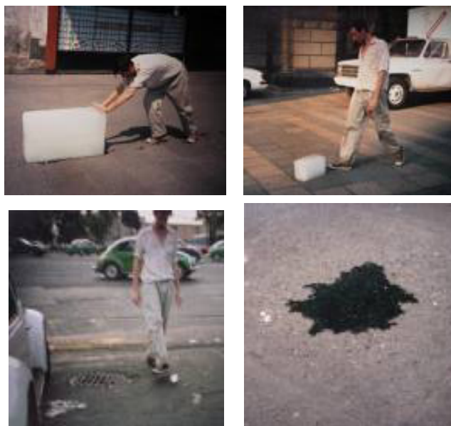
Imágenes 20, 21, 22 y 23. Francis Allÿs. Paradoja de la praxis. Algunas veces hacer algo no lleva a nada . México D.F., 1997. Acción registrada en video.

Al poner en juego un proceso sin producto, la obra de Allÿs ha adoptado algunos rasgos formales ya vigentes en el arte desde la segunda mitad del siglo XX, como la desvirtuación del producto objetual de la obra, problema central en el Arte Conceptual; la reducción del carácter material y manual del trabajo artístico, fundamento del Minimal Art; y la exaltación protagónica del proceso mismo, ya sea como investigación o como elaboración (llevada a espacios exhibitivos mediante documentos o registros del proceso), postulado central del llamado Arte de Proceso, consolidado a partir de la década de 1970. Allÿs radicaliza en su obra varios de estos rasgos, denominando sus prácticas ' ensayos ' (en el sentido, usado en teatro o danza, de prueba anterior a la presentación final de una obra). En los ensayos de Allÿs queda permanentemente pospuesta la culminación. Si, como queda expuesto en el concepto de trabajo de Marx, el proceso del trabajo humano se diferencia del de los animales en que al final se obtiene un producto que existía ya al comienzo en la imaginación del obrero en forma ideal, y logrado este ideal lo que en el trabajador era dinamismo, se presenta ahora en el producto como quietud, el ' ensayo ' rompe el ciclo en sus extremos. El ensayo no ha sido configurado a priori como producto ni tampoco llega a final como producto.