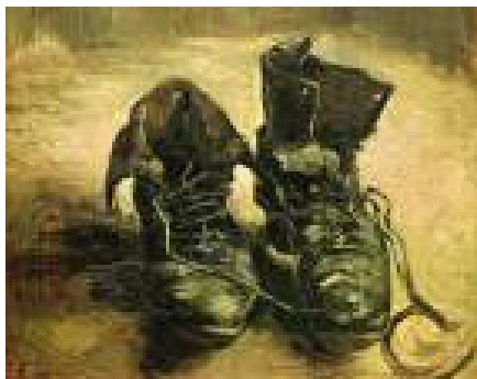
Imagen 04. Vincent Van Gogh (1853-1890), Un par de zapatos , 1886. Museo Van Gogh, Holanda.

La determinación de cosa tiene su origen en una interpretación del ser-utensilio del utensilio, en el proceso de utilización encontramos su carácter, su familiaridad, cuando ni siquiera las miramos ni las sentimos. Eso es lo importante de un buen par de botas de trabajo, un “par de botas de campesino”, por ejemplo, como las pintadas por Vincent Van Gogh . ¿Qué puede verse allí en el cuadro de Van Gogh? —pregunta Heidegger— todo el mundo sabe en qué consiste un zapato, un tipo de utensilio que sirve para calzar los pies, en el caso de las botas, con el fin de trabajar en el campo, donde son precisamente lo que son, “Lo son más cuanto menos piensa la labradora en sus botas durante el trabajo, cuando ni siquiera las mira ni las siente” (Heidegger, 2005b, p. 23).