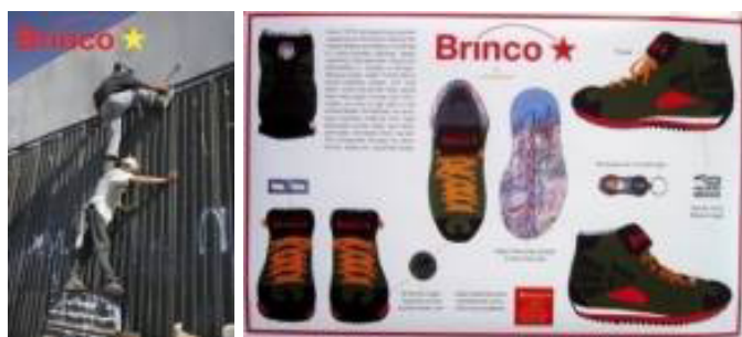
Imagen 12,13, 14, Judi Werthein. Brinco . Intervención, Insite, 2006. Tijuana, San Diego.

Las botas Brinco al tiempo que son una obra de arte, sirven a los inmigrantes ilegales para cumplir una meta de la vida, su uso hace parte de la obra. Las botas son buenos útiles para realizar las tareas de brincar el muro, huir de los guardias fronterizos y los granjeros estadounidenses que les disparan, orientarse, curarse de las heridas, es decir son de confianza para el migrante