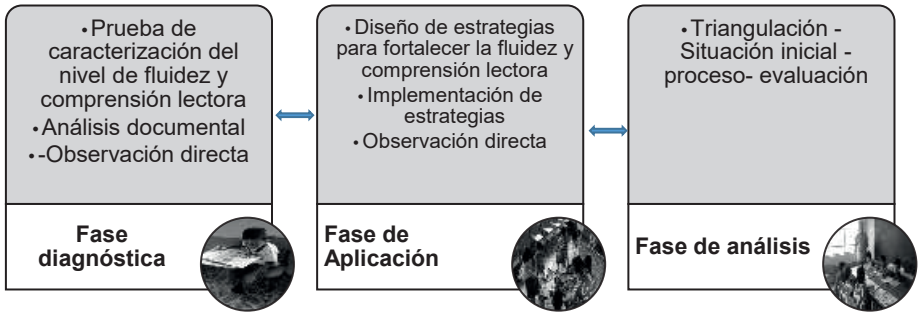
Gráfico 1. Fases de la investigación.